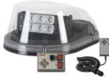
BL6 RX OMNILUX

Versione radiocomandata BL6 RX Omnilux provvista di: comando fisso di alimentazione e movimentazione, radiocomando di movimentazione con cavo spiralato e spinotto universale per presa accendisigari per la ricarica del comando.